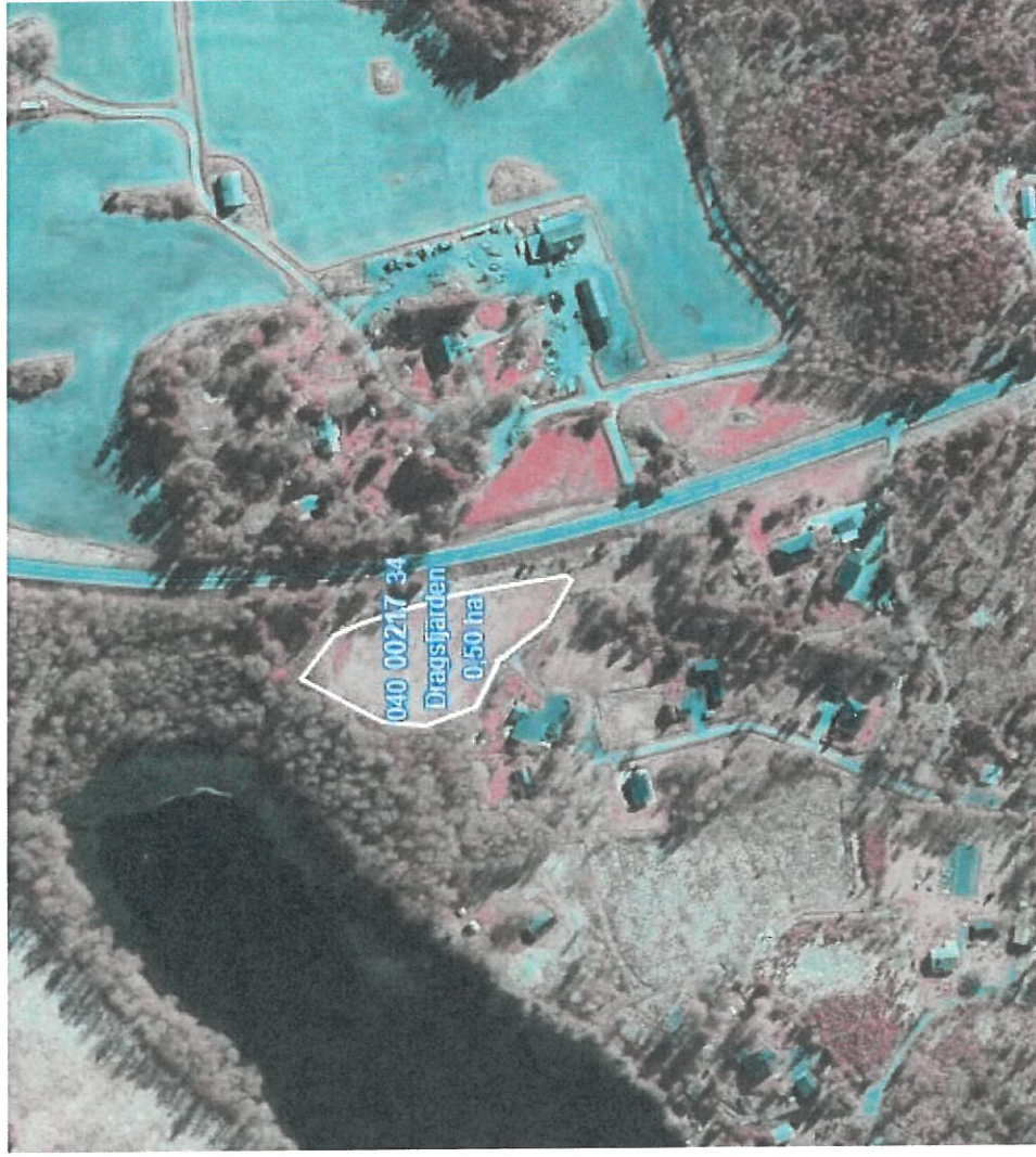
Nära Kärre korset